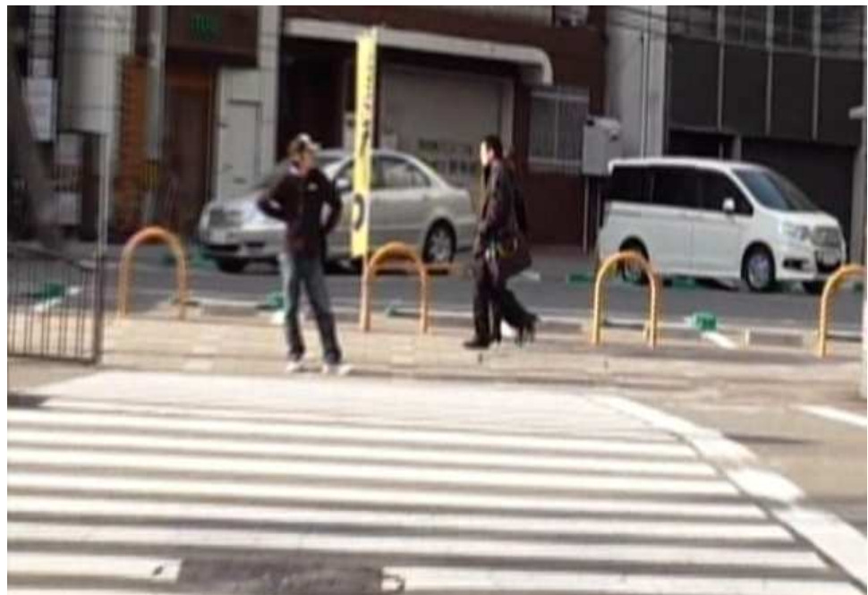
大阪市北区中津1丁目13番地付近