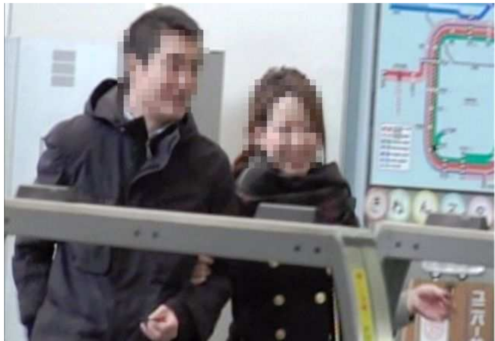
「JR ユニバーサルシティ駅」