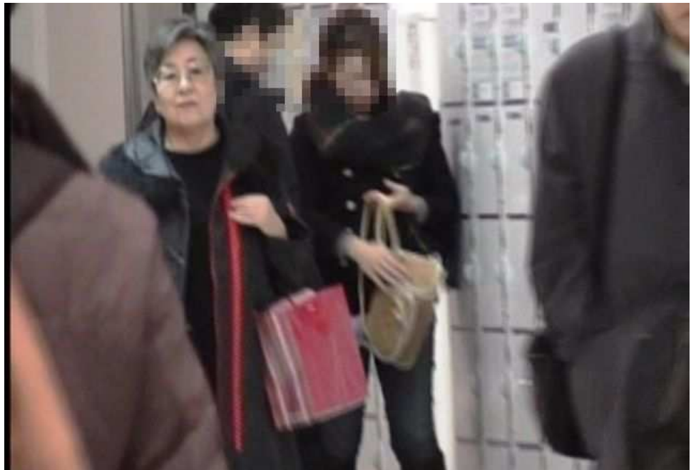
「JR 大阪駅」御堂筋北口付近